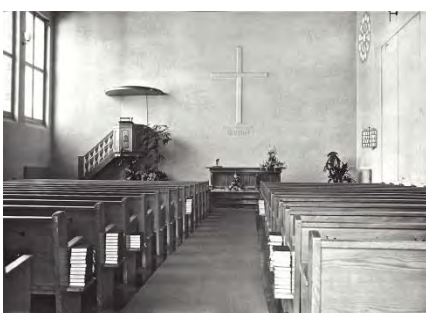
Innenraum vor der Renovation 1974

Verschiedenes wurde im Laufe der Zeit renoviert, ersetzt oder neu gebaut: Die Umgestaltung des Innenraums erfolgte 1974 (u.a. Stühle statt Bänke); nach 40 Jahren musste die Aussenfassade renoviert werden; 1979 wurde auch das Kreuz mit dem Chorwand – Relief „Die gespaltene Welt“ ersetzt; 1990 gab es neue Fenster mit dem Glasgemälde – Zyklus „Die sieben Schöpfungstage“; 1999 folgte die grosse Innen- und Aussenrenovation und Neubau des Anbaus und 2012 bekam die Kirche die heutige Beleuchtung.