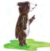
Text und Illustration: Ramona Wey

Nun schrieb und bebilderte sie ein Buch für 4 bis 5 jährige Kinder unter dem Titel: „Und du, kleiner Bär?“ In der Geschichte geht es um die Wünsche. Verschiedene Tiere erzählen, was sie sein möchten. Der Bär aber sprach, er wolle ein grosser Bär werden... Wenn das mal nicht ein Thema der heutigen Zeit ist?