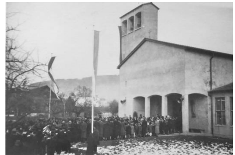
Einweihung 10. März 1940

Die Zahl der Reformierten in Kriens stieg stetig von 13 Protestanten im Jahre 1829 auf 1200 im Jahre 1939. 1928 wurde die Protestantenvereinigung gegründet. Es gab weder einen eigenen Pfarrer noch eine Kirche und die Gottesdienste fanden von nun an in der Aula des Kirchbühschulhauses statt. Eine eigene Kirche war der grösste Wunsch der reformierten Krienser. Der ausgeschriebene Wettbewerb für eine protestantische Kirche in Kriens ergab 23 Eingaben, aber kein baureifes Projekt. Schlussendlich entschied man sich für die Pläne des Architekten Carl Moosdorf. Bei der Grundsteinlegung im April 1939 wurde eine Kasette mit 40 Sachen eingemauert. Nach der Weihe der Glocken und dem Aufzug durch die Schüler im Dezember 1939 konnte am 10. März 1940 die Johannes-Kirche durch Pfarrer Alder eingeweiht werden.