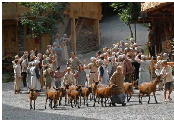
Tell Freilichtspiele Interlaken

Das vielfältige Angebot entnehmen Sie bitte der Beilage.