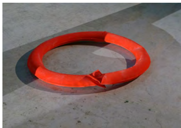
Peter Michael Weber, Animal_01. 2011

Material: aufgeblasenes Blech mit roter Farbe, Oberflächen mit Glasperlen beschichtet