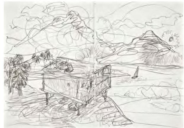
Aus dem Heft Selbst, 2009, Bleistift auf Papier www.bellpark.ch

Das zeichnerische Werk des Luzerner Künstlers steht bei dieser Einzelausstellung im Vordergrund.